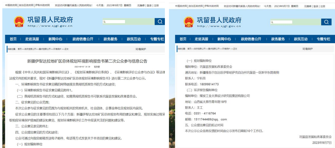
图 3-1 第二次网上公示截图（网络）