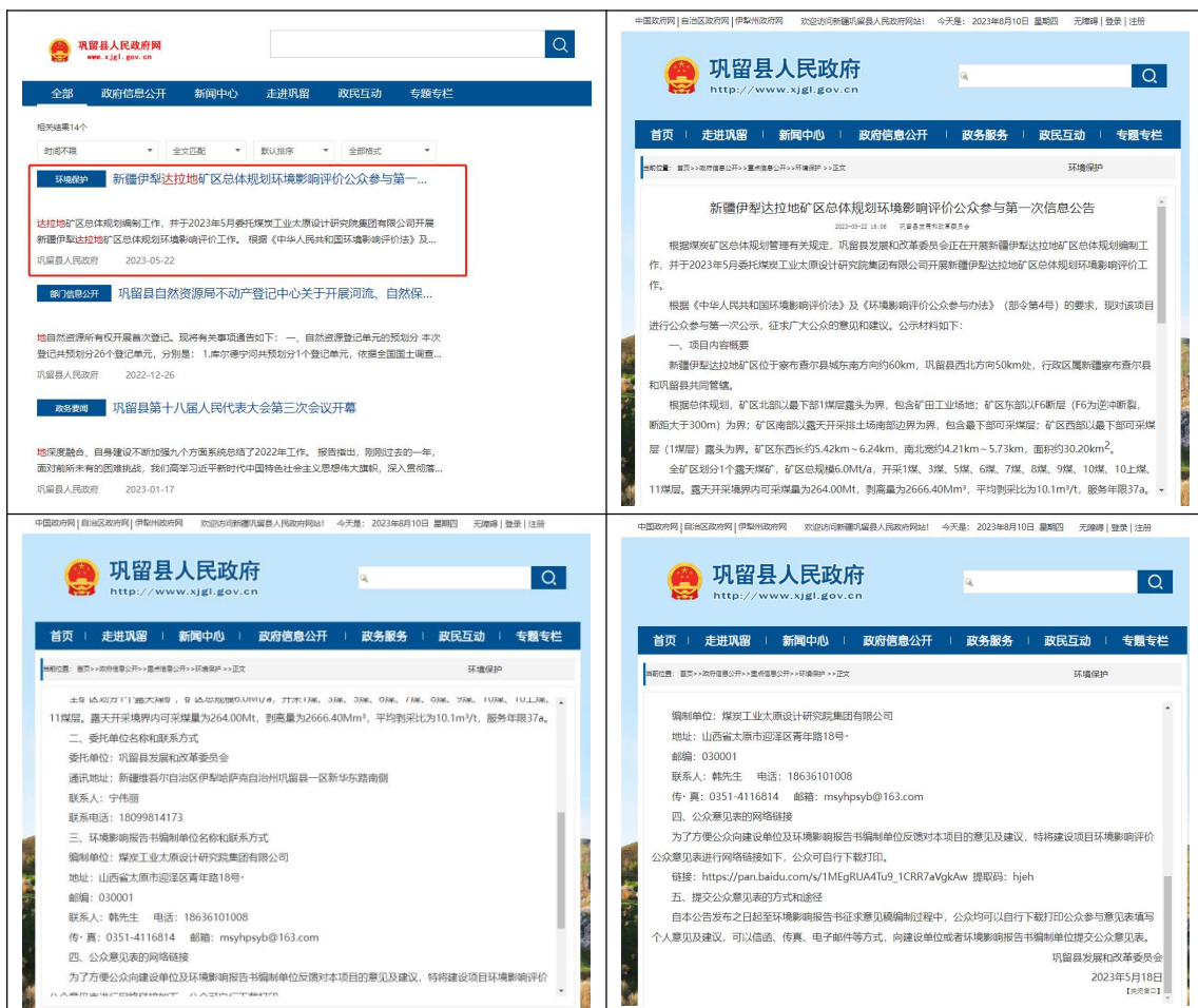
图 2-1 第一次网上公示截图