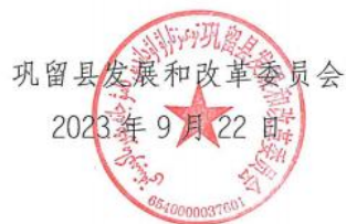
图 6-1 诚信承诺截图

我单位承诺，本次提交的《新疆伊犁达拉地矿区总体规划环境影响评价公众参与说明》内容客观、真实，未包含依法不得公开的国家秘密、商业秘密、个人隐私。如存在弄虚作假、隐瞒欺骗等情况及由此导致的一切后果由我单位承担全部责任。