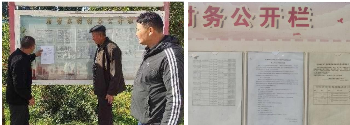
图 3-3 第二次公众参与公示照片（张贴公告）